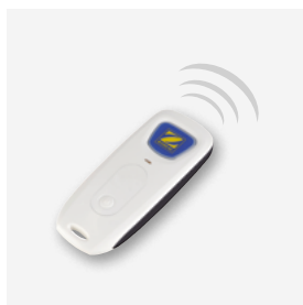
Comando à distância Kinetic