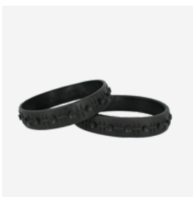
Roda da frente para piscina ladrilhada