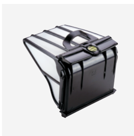
Filtro de grande capacidade (5 L) fácil de limpar