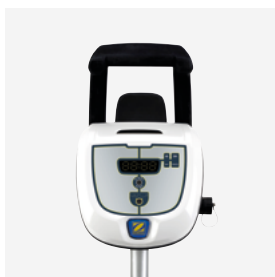
Central de Controle