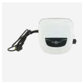
Caixa de comando