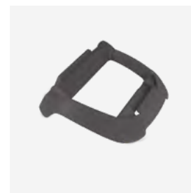
Suporte Caixa de comando