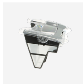
Filtro (3L) de fácil acesso